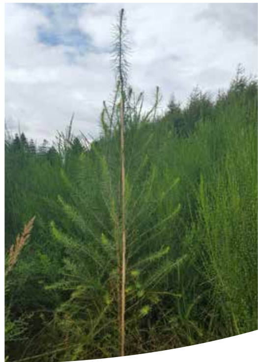
Afkom Tophøj FP.661. C. E. Flensburg afd. 127 efter 3. vækstsæson.

Overalt, hvor det er anbefalelsesværdigt at plante lærk. Med baggrund i den meget smalle vækstform er afkom af Tophøj FP.661 velegnet som indblandingsræart i løvtræs- og nåletræsbeplantninger.